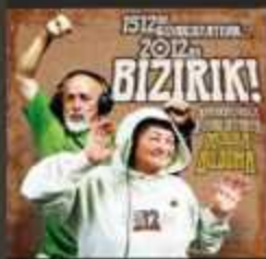
Nafarroa Bizirik ( Tierra Adentro ) 2012