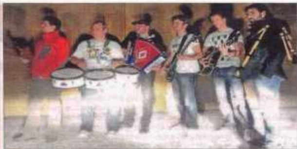
Formación actual del grupo Iparfolk.

GIRA / El combo ofrecerá dos conciertos en Glasgow