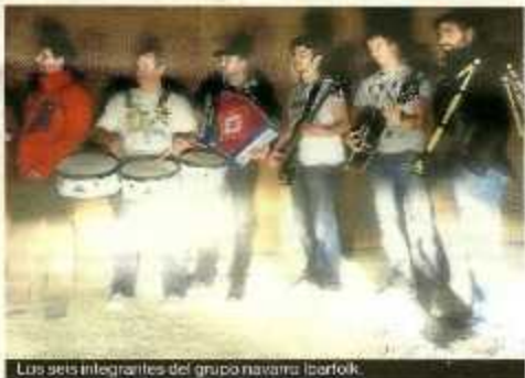
Los seis integrantes del grupo navarro Iparfolk.

La sala Big Star continúa con su potente apuesta por la cantera de grupos navarros, contando casi todos los fines de semana con dos bandas locales. Así, el próximo fin de semana será el turno de El Tren, que actuarán el viernes, día 26; y Fræwinds, que actuarán el sábado, día 27. a Nakano Pop