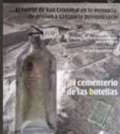
El cementerio de las botellas 2014 (Aranzadi, Pamiela, Txinparta)