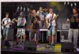
Iparfolk, en directo.

Iparfolk fue elegido uno de los tres y ahora deberá competir y defender sus valores en directo,