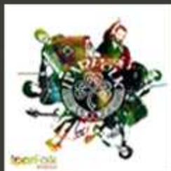
Kilombo 2013 ( 1er Cd Largo )