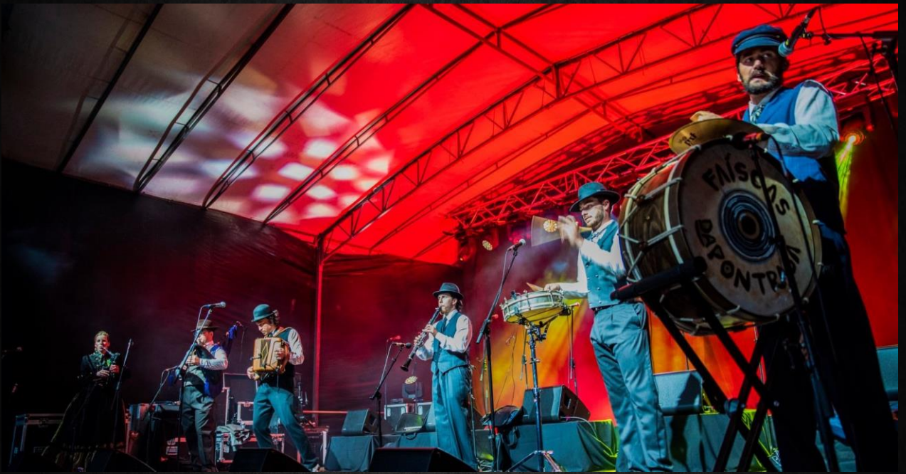
XIX Festa Folk Na Fin do Camiño (Fisterra)