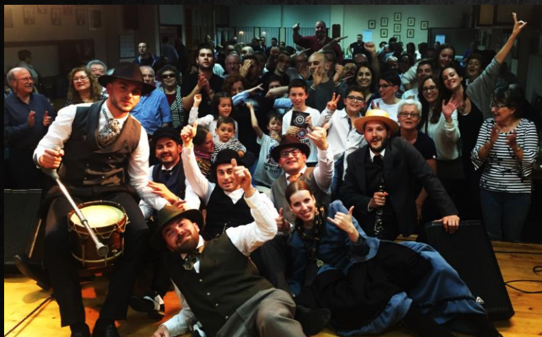
Centro Gallego de Vitoria (Vitoria, Euskadi)