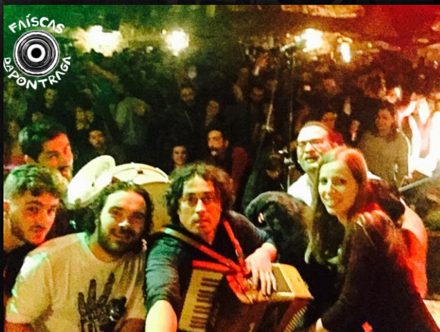
25º Edición Magosto Celta Balboa (León)