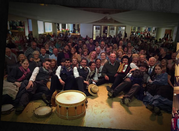
Mar del Plata (Arxentina)