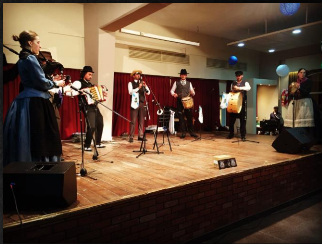
Bos Aires (Arxentina)