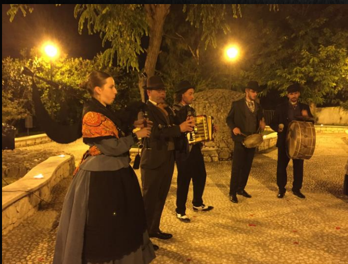
Coreno Ausonio (Italia)