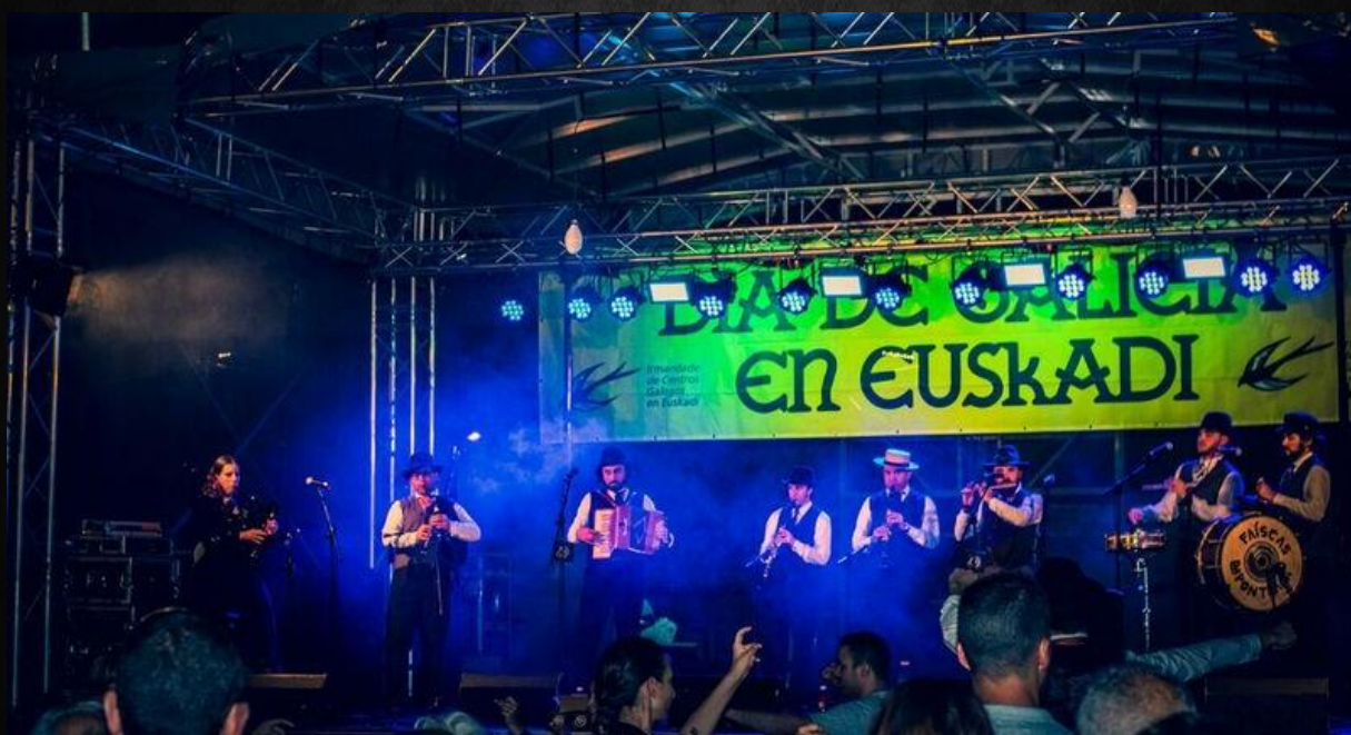
XXXIV Día de Galicia en Euskadi (Sestao, Euskadi)